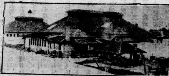
合衆國フロリダ州農園監に於ける受刑者の營舎

丘の上に美しい芝生を前にして十室より成る高い二階建の監督の舍宅がある。この舍宅の傍に廳舎が立つてゐて、茲にはフワーム及び會計の帳簿と共に受刑者の記録及びその領置品が保存せられてゐる。尙車馬道を南に進めば職員白塗りのコツテージが列んでゐて其先に大きな櫓がある。櫓の内には四箇の木造の大ドミトリ (合宿所) があつて、各自數箇の寢室、浴室、食堂を具へてゐる。ドミトリは凡て電燈を用ひ、大きな木造ストープがあり、換氣法は十分である。ドミトリの二つは病院、藥局、齒科室及び手術室に充てられてゐる。女子部は白人と黒人との爲め