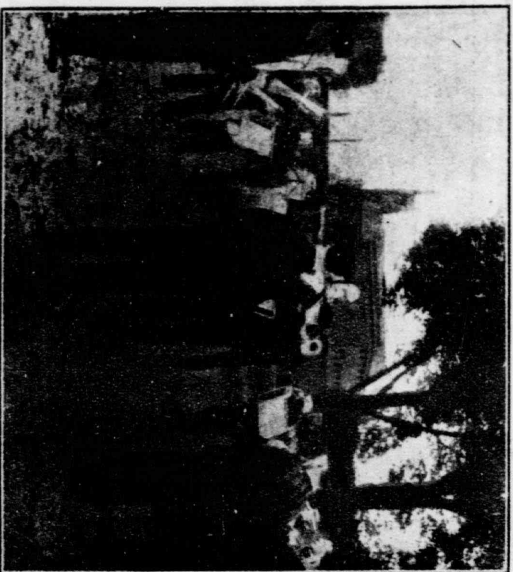
内所務刑るけだに日の後最のヲ業就 (左) トスケーオの る鳴し祝な日曜日にリ終の業奏が誰の會教の内所務刑